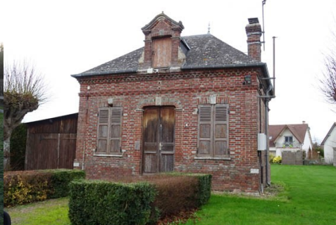
L'ancienne mairie en brique