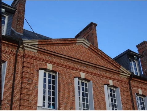
Le fronton sud