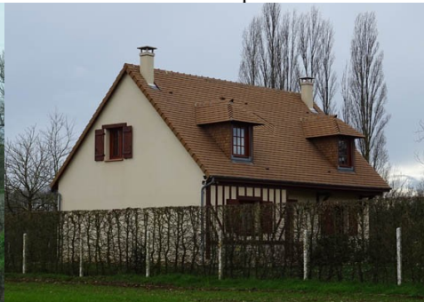
Le colombage est bien présent