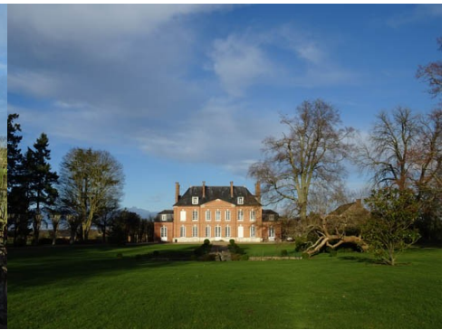
La façade Sud