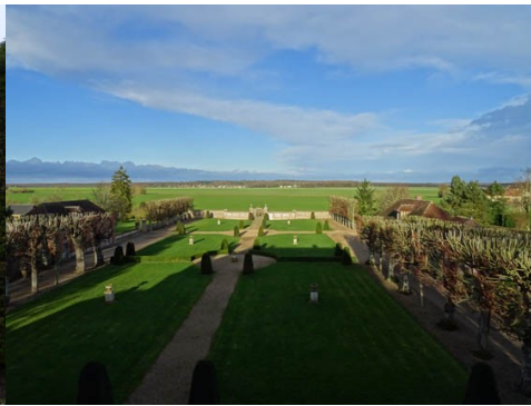
Vue depuis la façade nord