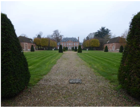
Vue éloignée de la façade Nord