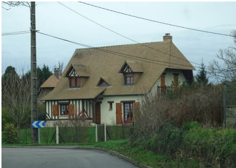
Quelques maisons dans les abords