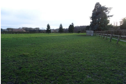
La motte féodale

Les avis seront cohérents avec ceux émis ces dernières années, à savoir : pas de maisons à volume compliqué (type V, W, Y, ou Z), pentes à 45° pour les volumes principaux, ardoise ou tuile plate de teinte brun vieilli, à 20u/m 2 , avec un débord de toiture de 20cm, enduit de teinte beige clair avec modénatures (au choix : chaînages, encadrement de fenêtres, soubassement, colombage...). *Voir les autres fiches.