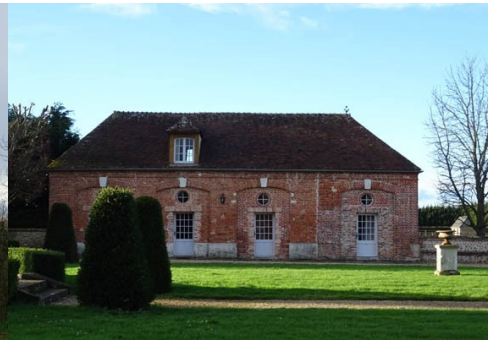
Les communs du château