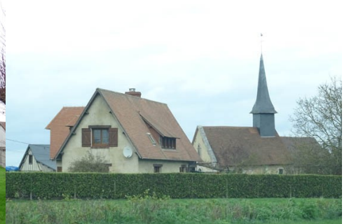
Le bâti rural avoisinant